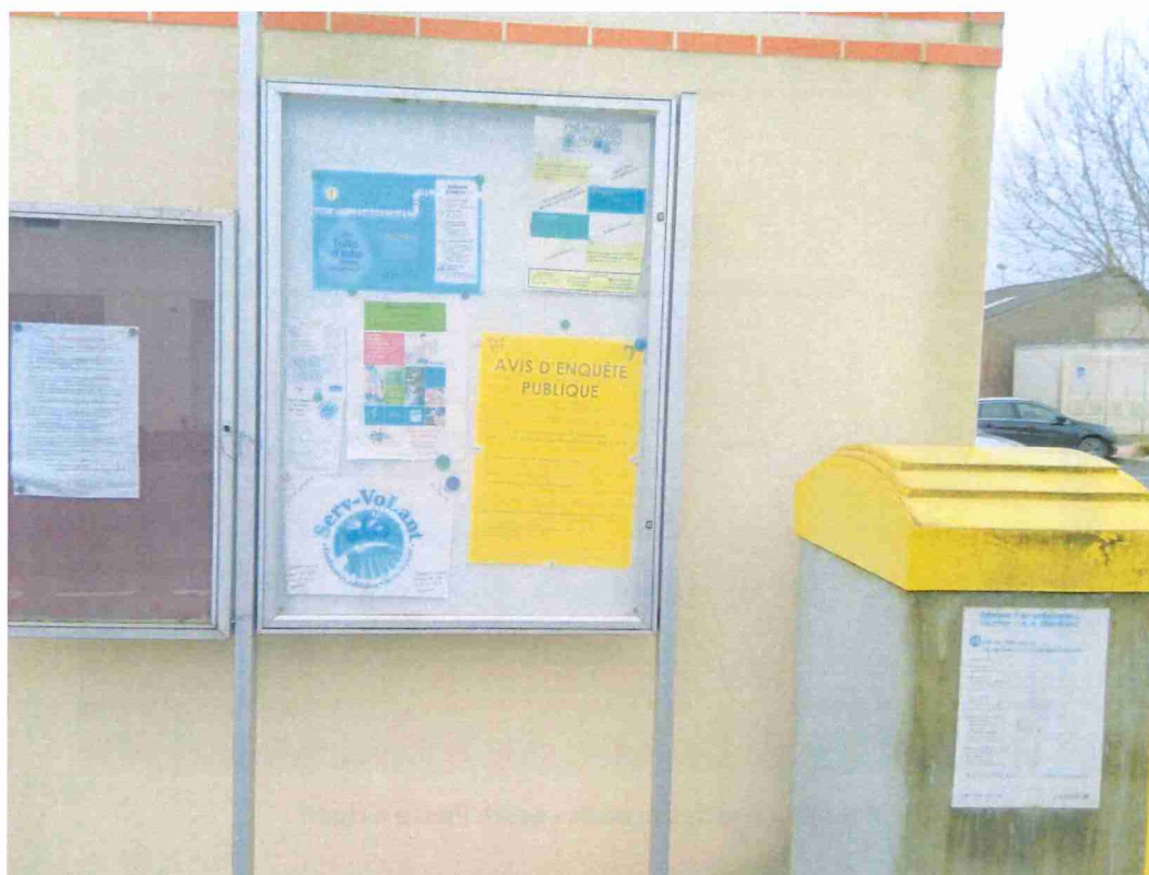
Panneau – commerce