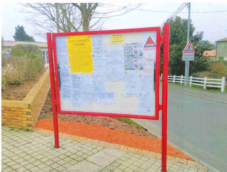
Panneau rue des acacias – Mairie Parvis de la Mairie Affichage sur les deux faces du panneau