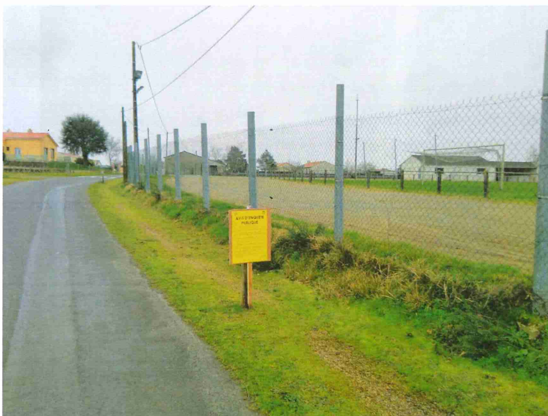
Terrain de foot